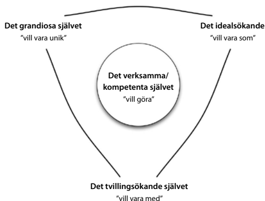
Figur 1. Illustrering av det tredimensionella självet.

I figur 1 visas en modell för människans själv, en modell som jag utvecklat (Sandvik, 2009) på basen av Heinz Kohuts teori (1986; 1988) om självet och dess utveckling.