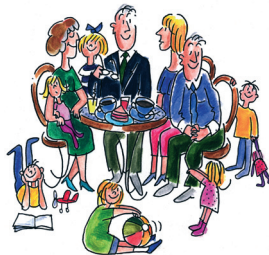
Är du en D, I, S eller K-personlighet?